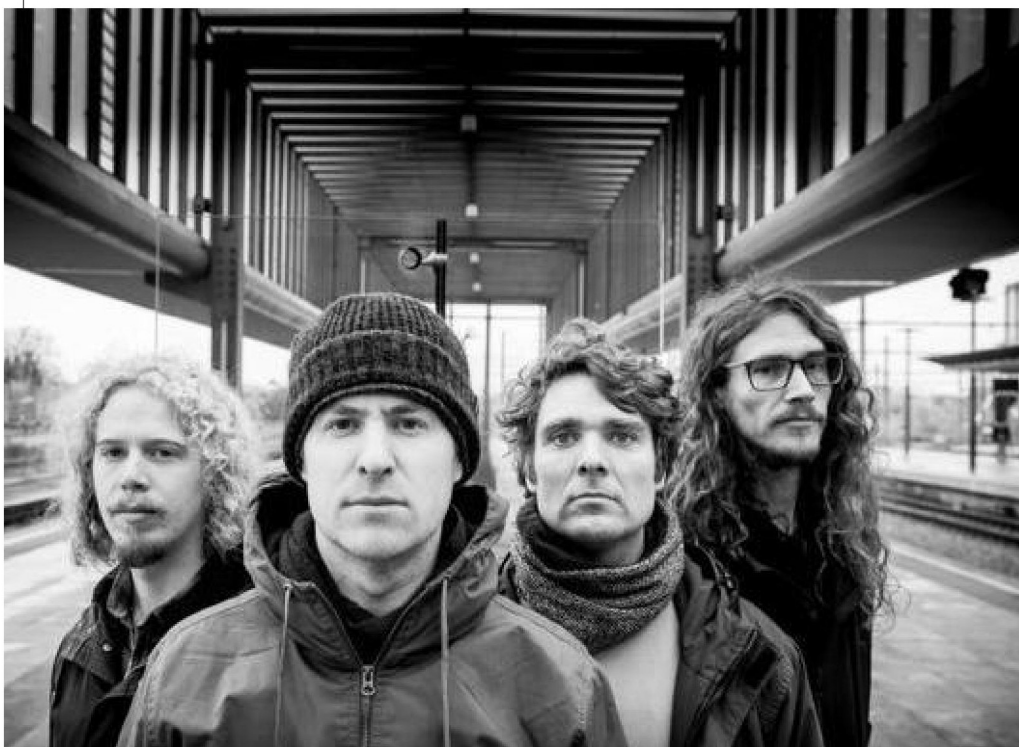
Bl!ndman, version percussions.