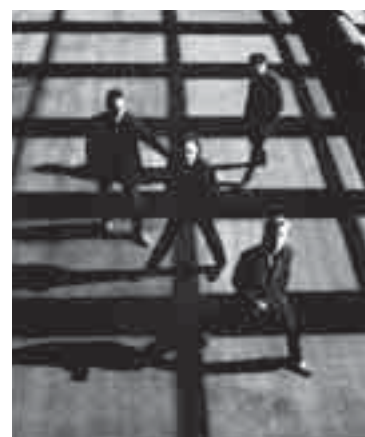
Blindman.