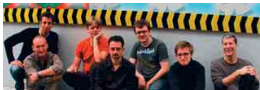
T-Unit 7.